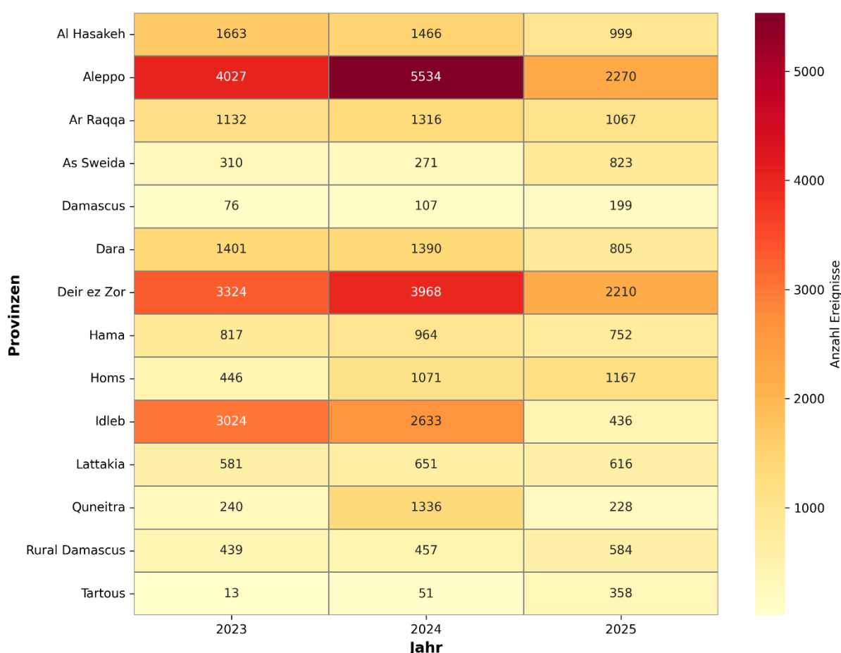
Abbildung 1: Heat Map mit Daten von ACLED (Kategorien «Gewalt gegen Zivilisten», «Explosionen», «bewaffnete Zusammenstösse», «Aufstände»).