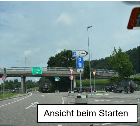
Ansicht beim Starten

Ankunft: Hurst, Autobahnrastplatz, Einfahrt rechts bis ans Ende, Höhe Kandelaber