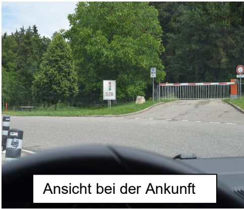
Ansicht bei der Ankunft