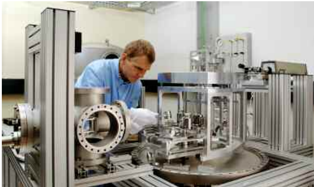
1 : Le nouveau comparateur de masse de 1 kg fonctionnant sous vide.

Plusieurs expériences ayant pour but d'améliorer la définition du kilogramme sont actives depuis de nombreuses