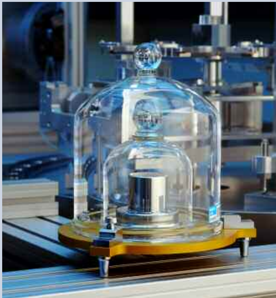
3 : Le prototype national du kilogramme N° 89 sera utilisé et conservé exclusivement sous vide.

Ce prototype sera utilisé exclusivement sous vide en association avec un empilement de disques de 1 kg du même matériau. Ce couple d'étalon, qui sera conservé en permanence dans les mêmes conditions, servira de référence pour la caractérisation du passage air-vide.