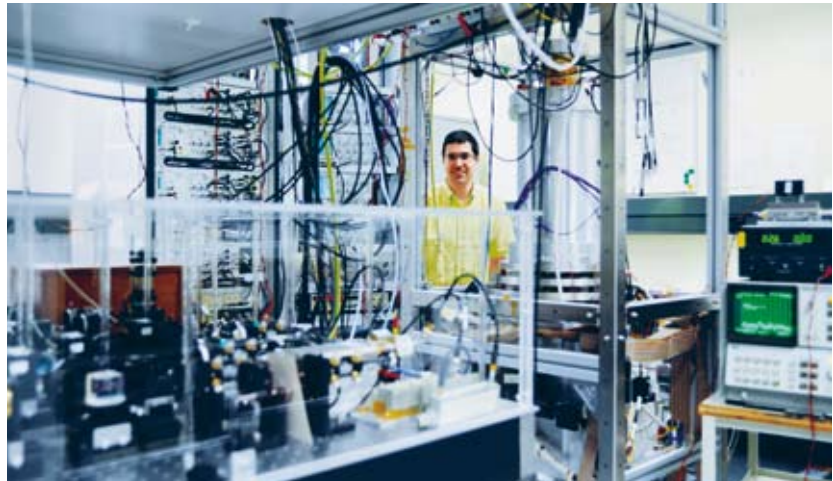
Cäsium-Springbrunnen des METAS – eine der genauesten Atomuhren der Welt.

Aus der UTC leitet das METAS wiederum die offizielle Schweizer Zeit ab und verbreitet sie. Unter anderem steht unter ntp.metas.ch ein Zeitserver zur Verfügung, mit dem Computeruhren auf wenige Millisekunden genau mit der offiziellen Schweizer Zeit abgeglichen werden können.