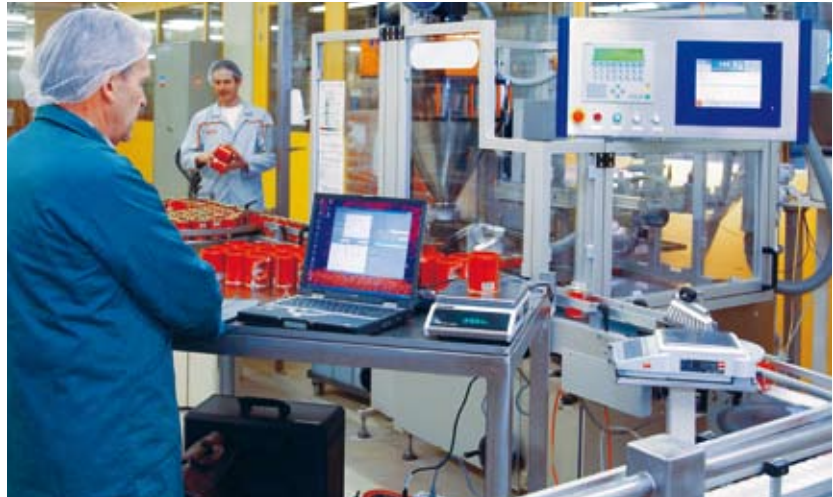
Eichmeister kontrolliert Fertigpackungen beim Hersteller.

Das METAS sorgt zusammen mit den kantonalen Eichämtern dafür, dass die gesetzlichen Bestimmungen eingehalten werden. Die Eichämter kontrollieren einmal jährlich Hersteller und Importeure. Bei Fertigpackungen mit vorgegebener Füllmenge prüft der Eichmeister stichprobenweise den Nettoinhalt der Packungen. Bei Fertigpackungen mit variabler Füllmenge eicht er die verwendete Waage, kontrolliert die Beschriftung und stellt sicher, dass die Verpackung nicht mitgewogen wird. Das METAS betreut und überwacht die Eichämter, bildet deren Mitarbeitende aus und informiert den Handel und die Öffentlichkeit. Zudem bereitet es neue Gesetzesbestimmungen vor und stimmt sie mit den wichtigsten Handelspartnern ab.