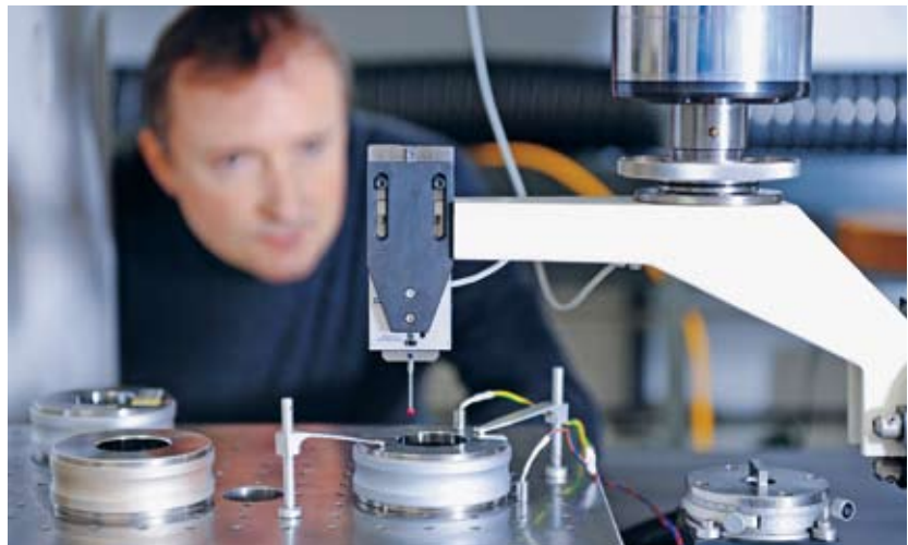
METAS-Mitarbeiter kalibriert Einstellung.

Deshalb verlangen Autobauer von ihren Zulieferern, dass deren Messmittel auf nationale Referenzmasse rückverfolgbar sind. Das heisst für den Zulieferer: Er muss seine Messmittel regelmässig kalibrieren lassen. Er kann dies in der Schweiz entweder direkt beim METAS tun oder bei einem von gegen 100 akkreditierten Labors. Letztere stehen in der Kalibrierkette eine Stufe unter dem METAS: Sie kalibrieren Prüfmittel für Unternehmen mit Messmitteln, die ihrerseits regelmässig vom METAS kalibriert werden.