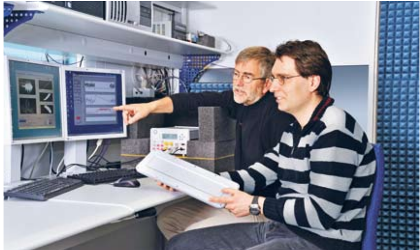
METAS-Ingenieure testen Geschwindigkeitsmessmittel im Labor.

Das METAS hat deshalb Verfahren entwickelt, um den Verkehr im Labor zu simulieren. Mit diesen Computersimulationen lassen sich Geschwindigkeitsmessgeräte effizient bei allen möglichen Verkehrssituationen prüfen. Das METAS entwickelt die Messplätze stetig weiter, um auch die allerneuesten Messgeräte prüfen zu können.