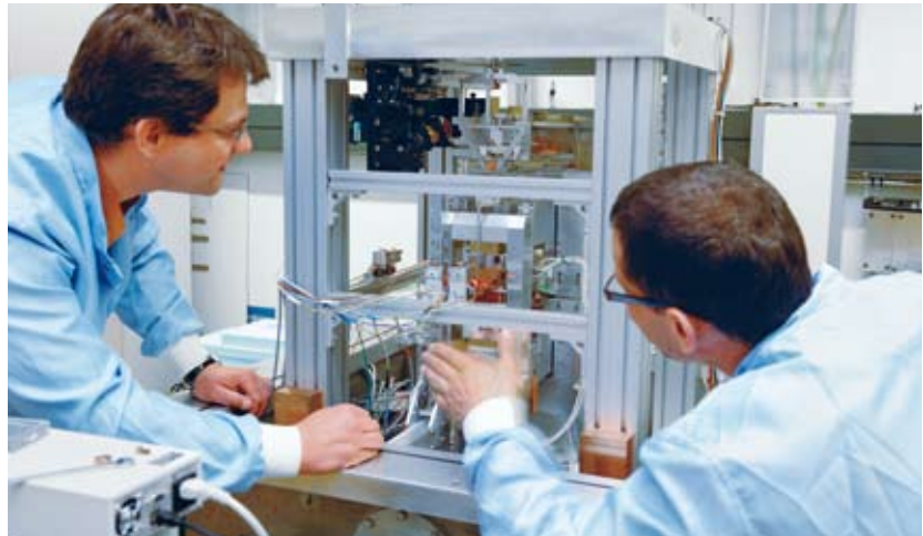
METAS-Forscher beim Weiterentwickeln der Watt-Waage.

Nebst dem METAS-Team feilen auch Forscher in den USA, in Kanada, Frankreich und China an Watt-Waagen. Noch arbeitet keine so präzise, dass sie das Urkilogramm ablösen könnte. Doch die Metrologen sind zuversichtlich: Früher oder später wird das Urkilogramm ins Museum wandern.