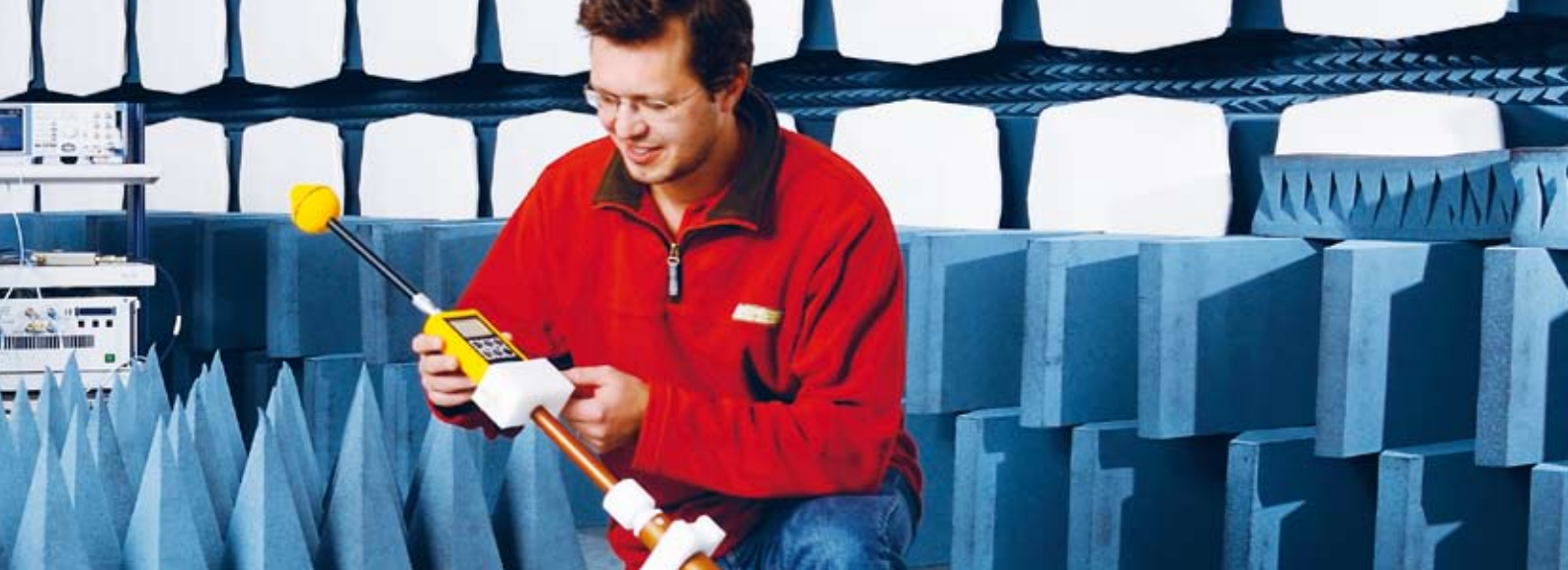
METAS-Physiker kalibriert in der echofreien Halle eine Messsonde für elektromagnetische Strahlung.