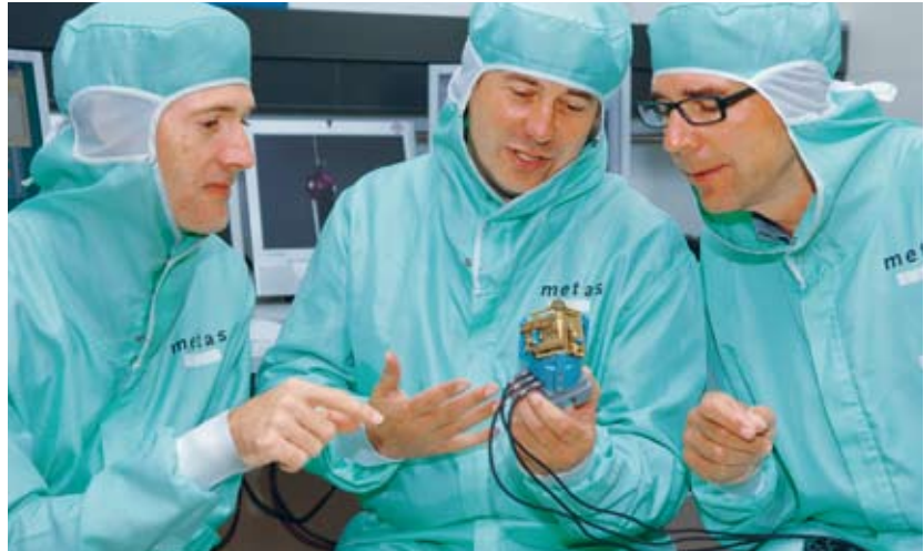
Ultragenaue Tastkopf – entwickelt von METAS-Wissenschaftlern (siehe Bild auf der Titelseite).

Lamellen, sorgen für Bewegungsspielraum. Das Gegenstück zum Tastkopf bildet ein ultragenauer 3D-Verschiebetisch, entwickelt am Zentrum für Produktionstechnologie von Philips in Eindhoven.