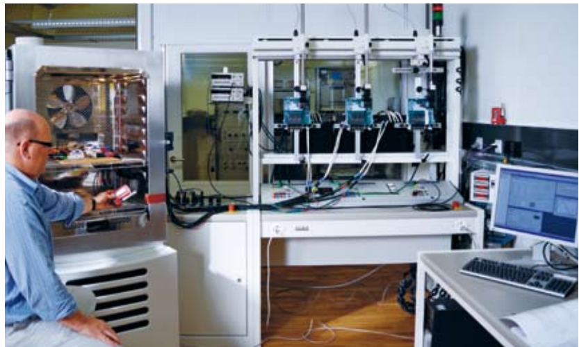
Baumusterprüfung eines Energiezählers im METAS.

Einmal in Betrieb, werden die Zähler von Eichstellen in der ganzen Schweiz im Auftrag der Elektrizitätsversorger überwacht. Dies geschieht mehrheitlich über ein statistisches Verfahren: Geräte gleicher Bauart und gleichen Jahrgangs werden in Gruppen zu 500 bis 5000 Zählern zusammengefasst. Aus jeder Gruppe wird alle fünf Jahre eine Stichprobe ausgebaut und nachgeeicht. Besteht diese zufällige Auswahl die Nachprüfung nicht, müssen alle Zähler der Gruppe ersetzt werden.