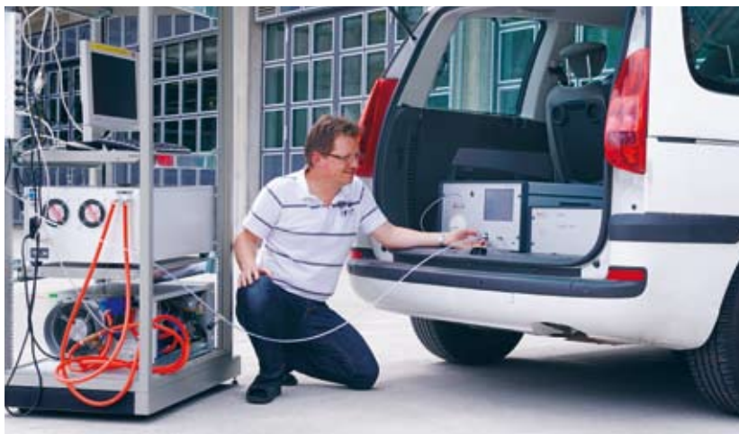
METAS-Mitarbeiter prüft Messgerät für Luftschadstoffe vor Ort.

Dank dieser Messkette und den stabilen Referenzwerten des METAS sind die in der Schweiz erhobenen Ozondaten national und international vergleichbar. Damit liefern sie eine sichere Basis für die Diskussion allfälliger Massnahmen, um hohe Ozonwerte zu senken.